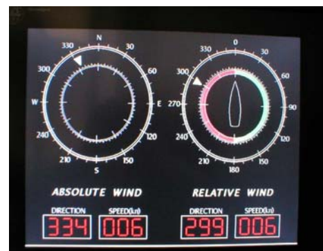
Foto – la pagina del vento sul monitor DFM 903

Inoltre è possibile di concatenare fino a 31 monitor DFM903.